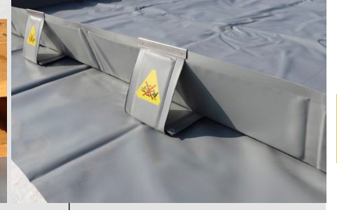
Yanal takviyelerin detayı