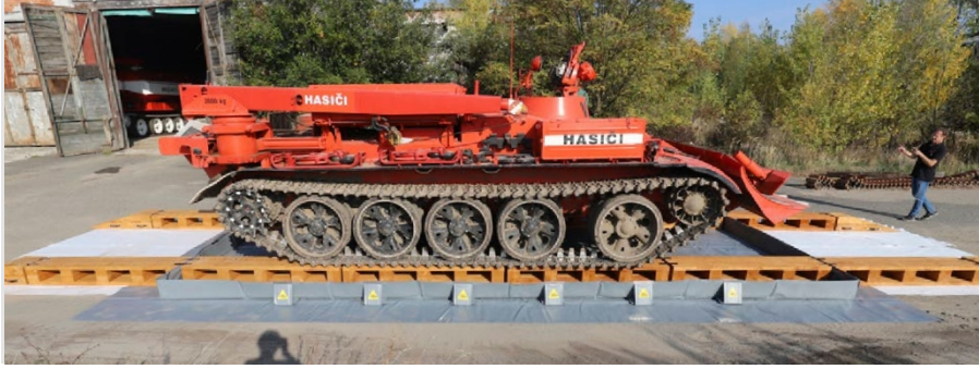
Ahşap rampaya giren paletli aracın detayı