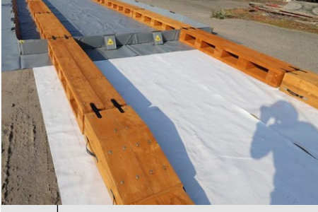
Ahşap rampalı havuz