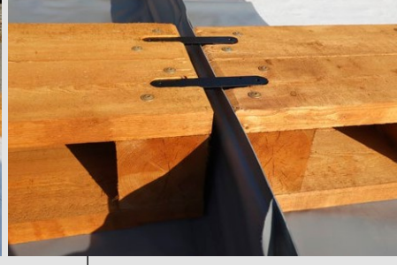
Ahşap rampanın sabitleme detayı