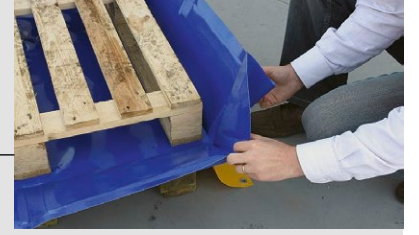
Katlanma detayları Köşelerin