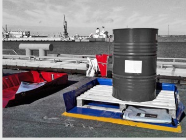
Köşeler mühürlenmemiştir, bu sayede branda paletin etrafına kolayca katlanabilir