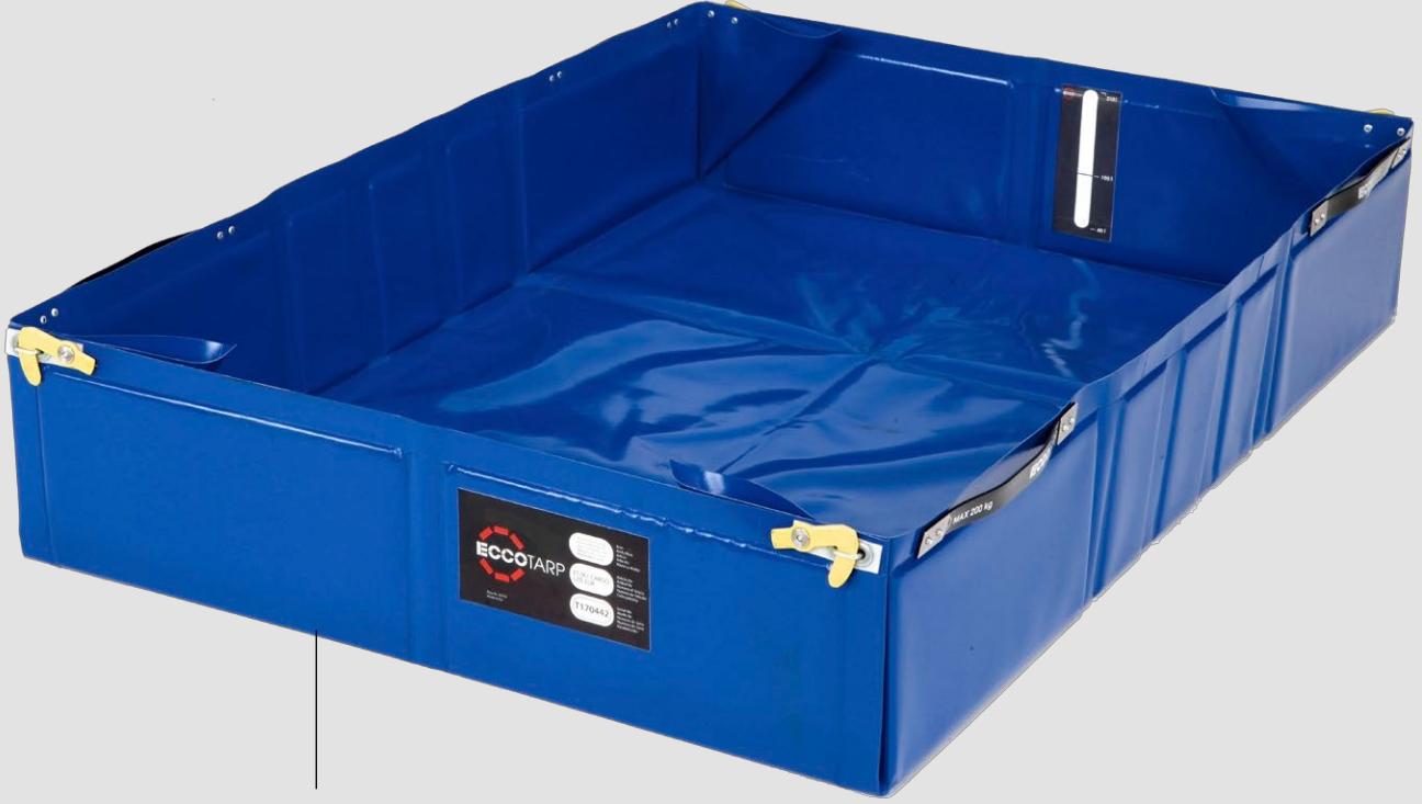
Cargo EUR Plus, yan tutamaklı