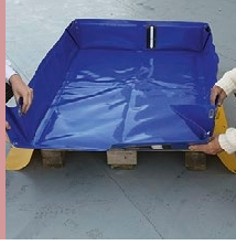
Drenaj deliği ve küresel vana ekleme imkanı