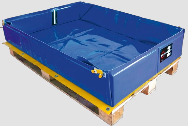
Kargo EUR kulpsuz

Endüstri ve taşımacılıkta kullanım için özel olarak tasarlanmış şekli ve boyutu sayesinde