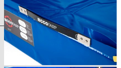
Yan tutamağın detayı kulp